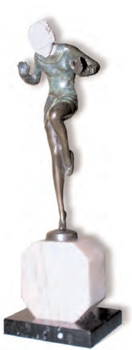
Danzarina , ca. 1930 Bronce patinado y marfil 22'5 cm de alto Firmado en la base "JLorenz"

La creación poética equivale en este poema tanto al acto amoroso como a la relación existente entre la amada