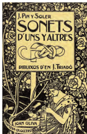
Portada para Sonets d'uns y altres , 1904