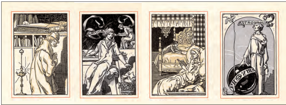
Cuatro de las ilustraciones para “Els cent aforismes”

un enmarcado de filete verde. Y todo el conjunto se embelece con las ilustraciones de Triadó, quien se siente muy seguro al tratar las ilustraciones sobre un tema del cual es gran conocedor, el mundo del libro. Triadó ilustrará la portada de la encuadernación en rústica, las páginas de guardas, un exlibris universal, un frontispicio (aguafuerte) y la portadilla, además de las 8 alegorías restantes, estampadas a varias tintas, dedicada cada una a los respectivos capítulos del libro, haciendo referencia, además, a uno de los aforismos contenidos. Triadó recurre a elementos del libro y simbólicos de la sabiduría, como los incensarios encendidos, cuyo humo ascendente evoca la espiritualidad de la sabiduría contenida en los libros, etc.