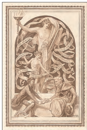
Alegoría de la bibliofilia, 1924