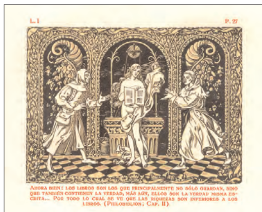
Ilustración para El Philobiblion

24 Cadalso, José, Los Eruditos a la Violeta , con el suplemento del mismo autor y otros anexos. Textos de las primeras ediciones ornamentados por José Triadó. Madrid, Librería de los Bibliófilos Españoles, 1928. Un volumen de 115 x 80 mm. De XL + 328 pàgs. (Pequeña Colección del Bibliófilo).