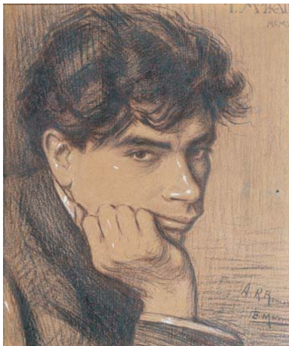
Retrato de Tomás Morales por ELADIO MORENO DURÁN, 1908 Carboncillo sobre papel 34 x 27,8 cm Firmado en el ángulo inferior izquierdo Dedicatoria en el ángulo inferior izquierdo A R. Romero [Rafael Romero, Alonso Quesada] Casa-Museo Tomás Morales

Por otro lado, si se ha aceptado convencionalmente el año 1908 como el momento de madurez del modernismo canario, fecha de la publicación de Poemas de la gloria, del